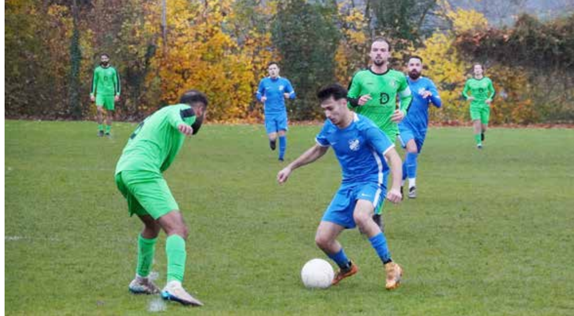
Mit dem 2:2 Unentschieden zu Hause gegen den Tabellendritten Vikt. Dieburg beendete die SG Ueberau die Vorrunde in der KLA Dieburg.