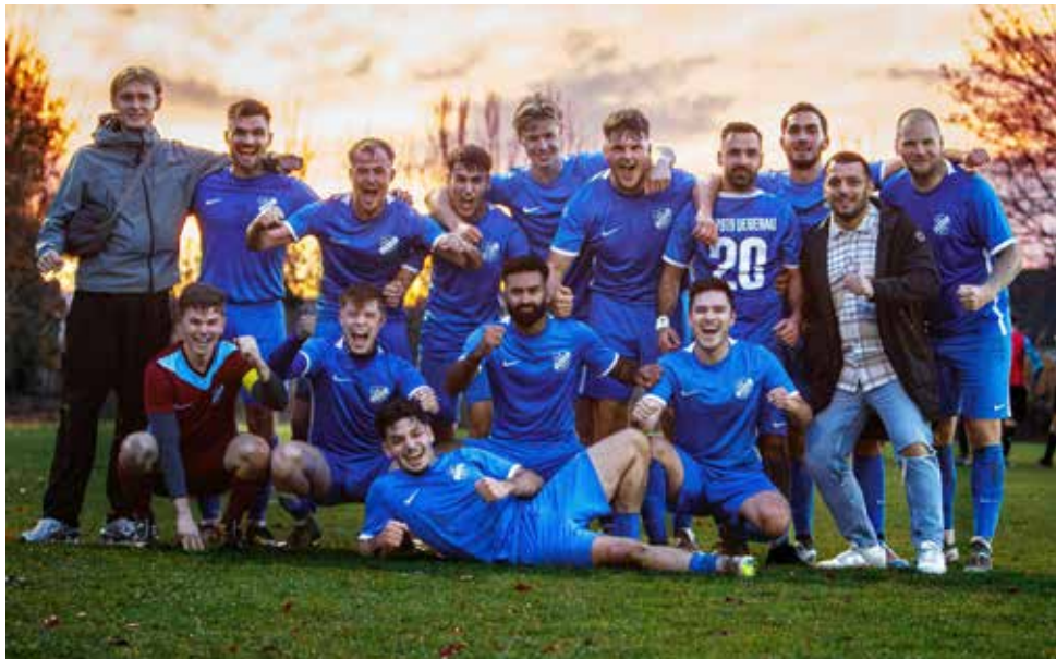
Die 1. Mannschaft nach dem Spiel gegen Vikt. Klein-Zimmern.