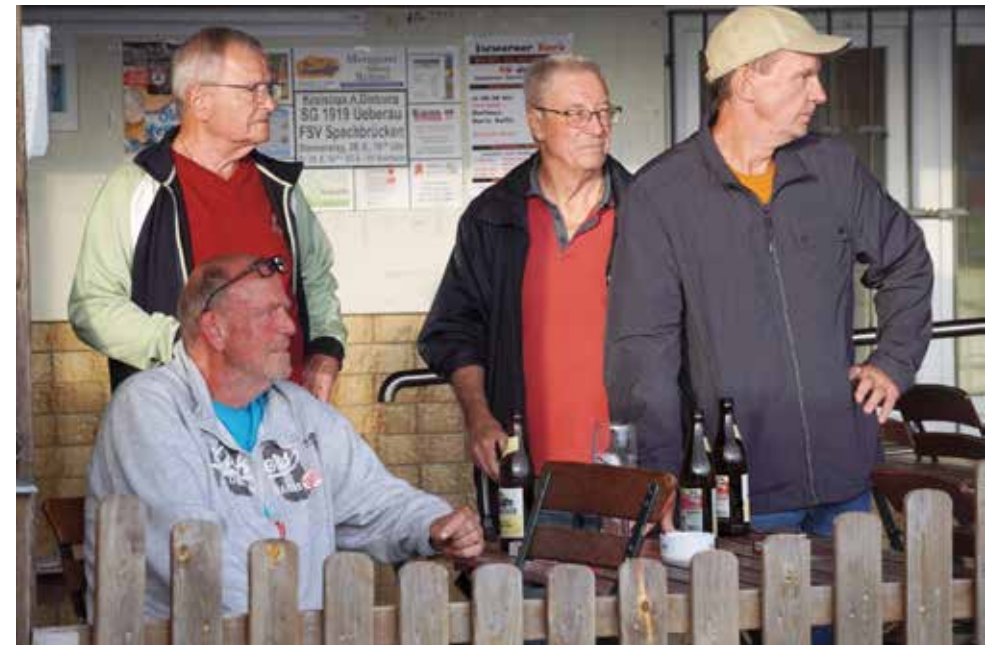
SG-Schnappschuss: „Die Drei von der Tankstelle“.