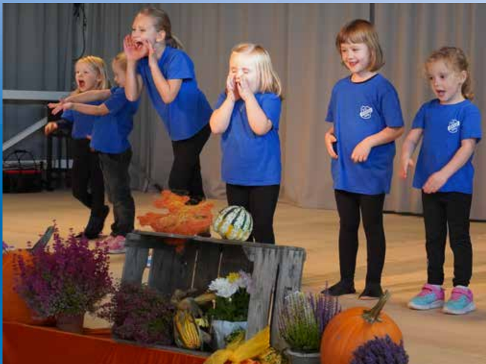
Die „Flohhopser“ und die „Minionhopser“ der SG zeigten beim Ueberauer-Seniorennachmittag am 18. Oktober im Sportheim ihren Tanz „Laufende Tiere“.

Mitteilungen der Firma A.J. Werbung für die SG Ueberau