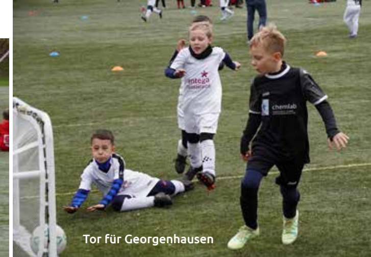
Tor für Georgenhausen

mehr und mehr entdeckten. Die Freude über das Spiel und die Unterstützung der Fans schienen alle Nervosität zu verdrängen. Insgesamt war das Spielfest nicht nur ein sportliches Ereignis, sondern auch ein Erleben der Gemeinschaft und der ersten Erfahrungen im Fußball.